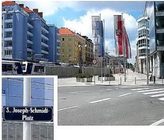
Площадь Йозефа Шмидта в Вене

Area) des Hauses der Österreichischen Lotterien im Bereich Kleistgasse/Aspangstraße seinen Namen. Am 28. Februar wird ab 15 Uhr zu einem großen Fest geladen.