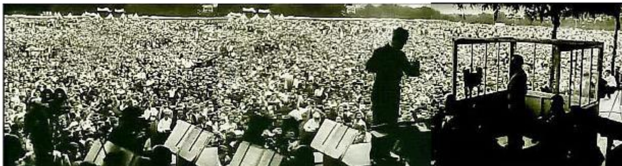
Панорама концерта на поляне в 25 км от Амстердама - более 100 000 (!) зрителей