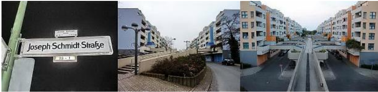
Необычная двухъярусная улица Йозефа Шмидта в Берлине

Музыкальная школа имени Йозефа Шмидта в Берлине 16 ноября 2007 г. в день 65-летия гибели певца здесь была открыта постоянная экспозиция из 18 стендов, посвященных жизни и творчеству великого тенора