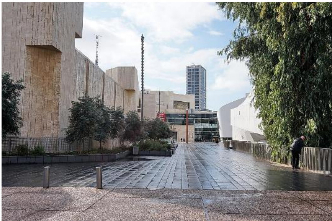
Аллея Йозефа Шмидта в Тель-Авиве