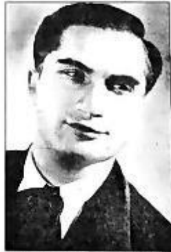
Joseph Schmidt.

Der kleingewachsene Mann mit der großen Stimme und eigenartigem Timbre war neun Jahre auf der Flucht, ehe er 1942 in einem Schweizer Flüchtlingslager an den Folgen einer Kehlkopfentzündung 38jährig starb. In Wien Landstraße erhält jetzt ein Platz beim