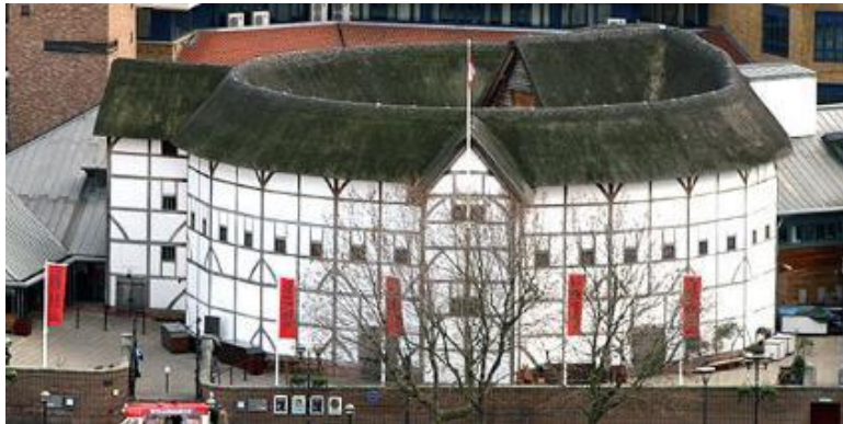
Театр «Глобус» в Лондоне