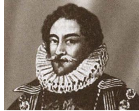
Роджер Мэннерс 5-й граф Рэтленд

Елизавета неожиданно назначает его наместником Ирландии. В конце марта Эссекс отплывает в Ирландию с целью подавить мятеж восставших против Англии ирландцев. Верные графу Рэтленд и Саутгемптон следуют за ним. Рэтленд вскоре вернулся в Англию из-за плохого самочувствия (болели ноги). Он поехал лечиться в Бат, на горячие источники,