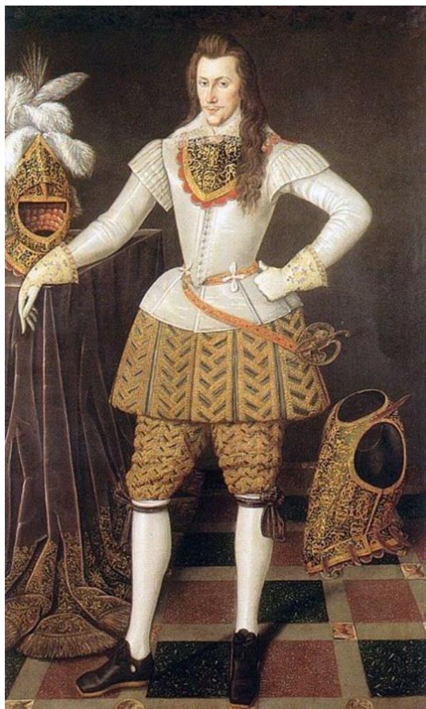
Генри Ризли - 3-й граф Саутгемптон

Кто же этот граф Саутгемптон? Генри Ризли 3-й граф Саутгемптон (1573 г. — 1624 г.) был блестящий и влиятельный аристократ, мужчина необыкновенной красоты, блондин с