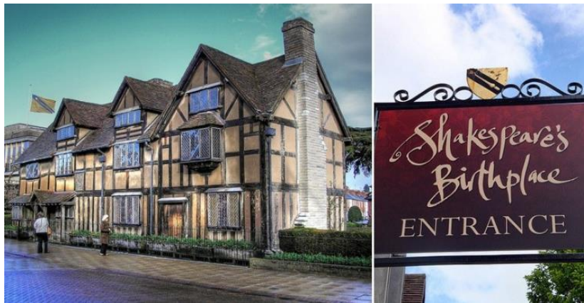
Музей Шакспера в Стратфорде-на-Эйвон

появляется в посвящении графу Саутгемптону: «любовь, которую я питаю к вам беспредельна. То, что я создал принадлежит вам, то, что мне предстоит создать, тоже Ваше».