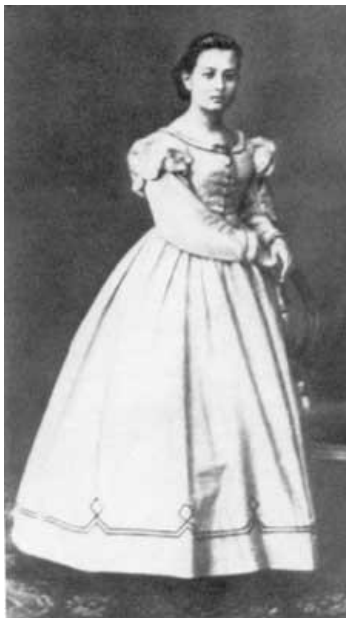
Софья на балу

Софья Васильевна отличалась разносторонним образованием, следила за литературой, любила театр. Она была редактором журнала “Acta mathematica”. Много читала, например, “Scientific American”. В газете “Новое время” помещала театральные рецензии и научные обзоры. Одна из научных статей была посвящена вопросу о прямом использовании солнечной энергии. Указав на то, что запасы каменного угля истощаются, Ковалевская подчёркивает важность непосредственного получения и накопления энергии солнца. В других статьях она говорит о воздухоплавании, рассматривает новейшие изобретения – телефон и телеграф.