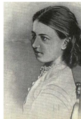
Софья в юности