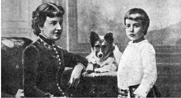
Софья с дочкой

Софья Васильевна вместе с дочкой уехала в Берлин, а её муж в Одессу. Владимир окончательно запутался в своих финансовых делах и покончил с собой. Ковалевская получила приглашение в Стокгольмский университет, и она уехала, оставив старшей сестре свою дочь.