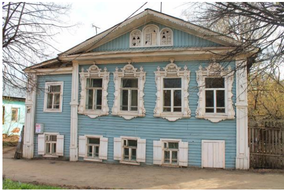
Дом Ривтиных в Сарапуле